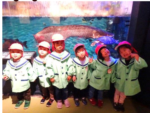
水族館には大きいウミガメやいろいろなお魚、ペンギンなど海の生き物がたくさんいました！