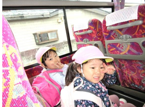
バスに乗って寺泊水族館へレッツゴー