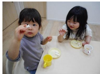
「みてみて!! 魚のかたちだよ」